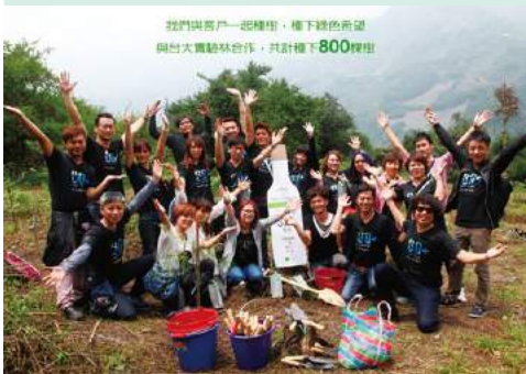
▲與客戶一起種樹，種下綠色希望