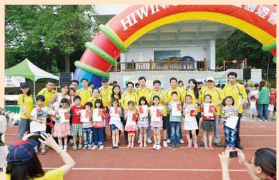
▲樂活家庭日活動，鼓勵攜家眷同歡