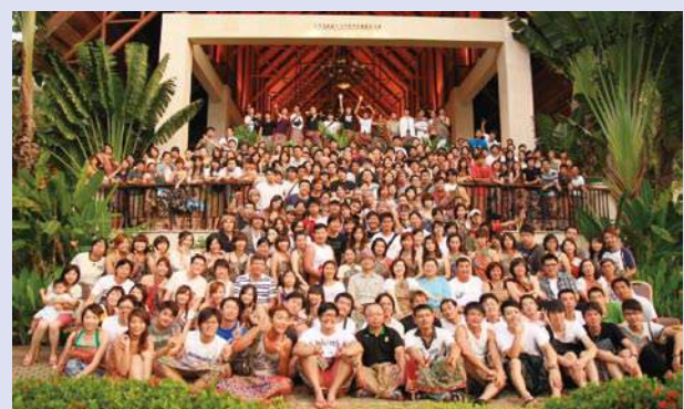
▲親子活動，增加員工家庭與公司間互動