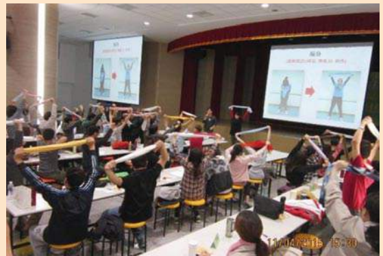
▲健康促進活動，同仁伸展體適能