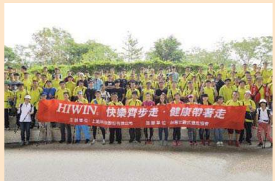
▲舉辦健走活動，促進員工身心平衡